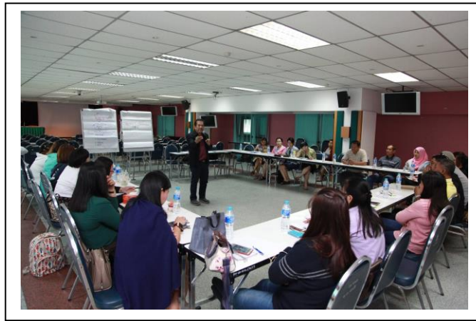
ภาพที่ 2 การประชุมเชิงปฏิบัติการค้นหาปัญหาและความต้องการจากชุมชน

สหกรณ์ฯ จะขับเคลื่อนไปได้อย่างต่อเนื่อง จำเป็นต้องมีรูปแบบการบริหารจัดการที่เหมาะสมอย่างไร จะต้องมีความรู้ความเข้าใจด้านการเงินและบัญชี ดังนั้น จึงเกิดการพัฒนาโครงการวิจัยเรื่อง การพัฒนาทักษะด้านการเงินและบัญชีโดยใช้นวัตกรรมเพื่อการเรียนรู้แบบมีส่วนร่วมสำหรับสหกรณ์เคหสถาน ชุมชนริมคลองลาดพร้าว