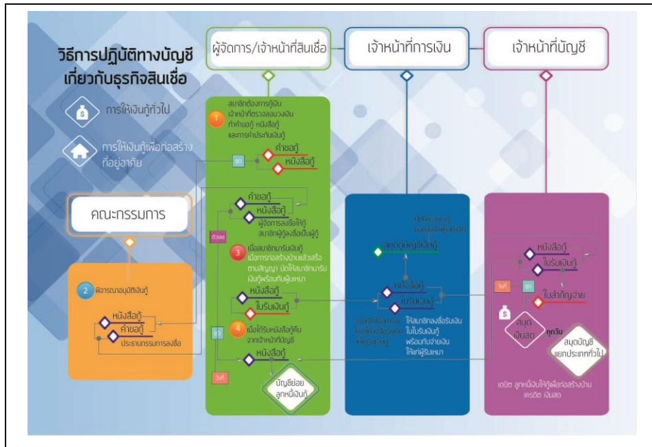
ภาพที่ 3 นวัตกรรมสื่อเรื่อง วิธีการปฏิบัติทางบัญชีเกี่ยวกับธุรกิจสินเชื่อ